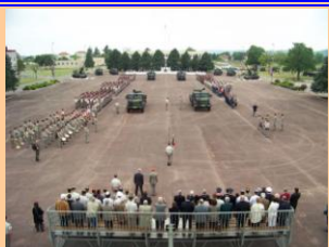
Camp de La Valbonne N.D de Fourvière - Lyon