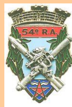
54 e RA-Hyères