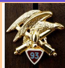
93 e RAM-Varces