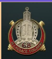
68 e RAA